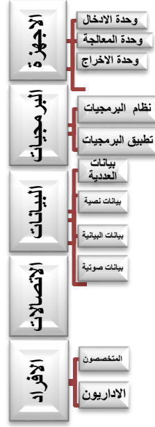
الشكل (1) مكونات تكنولوجيا المعلومات*